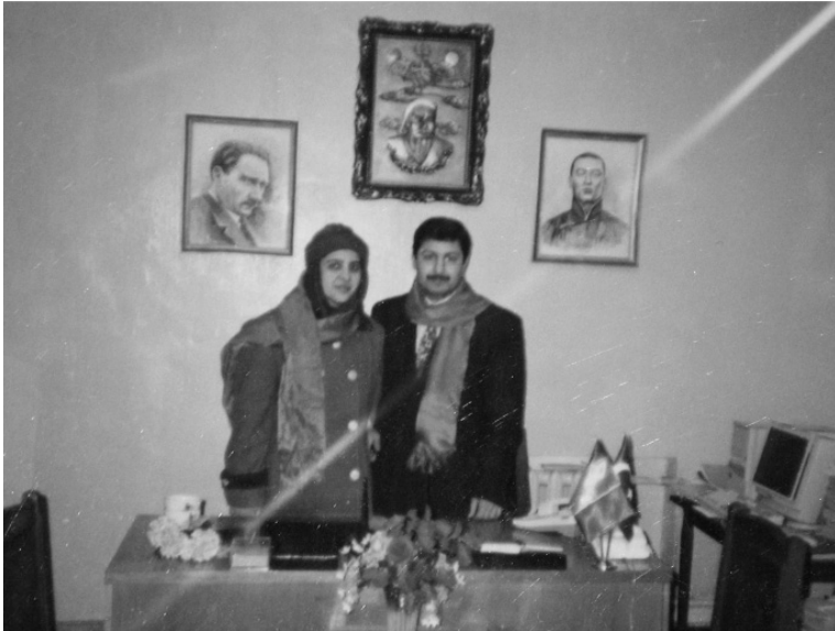
Mazide kalan tatlı bir hatıra

O kader birliği ettiği arkadaşlarıyla kardeş olmasını da onları sevk ve idare edecek idarecilik sanatına uygun şekilde davranmasını da gayet iyi biliyordu.