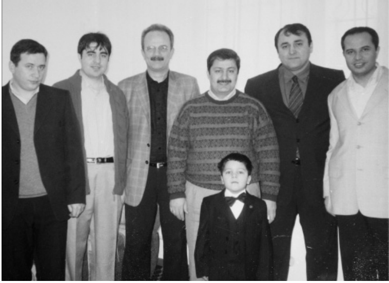
Moğolistandaki Türk müteşebbisler ile

Çünkü o zamanlar haftada bir uçak seferi vardı ve o haftanın uçağı yeni gitmişti.