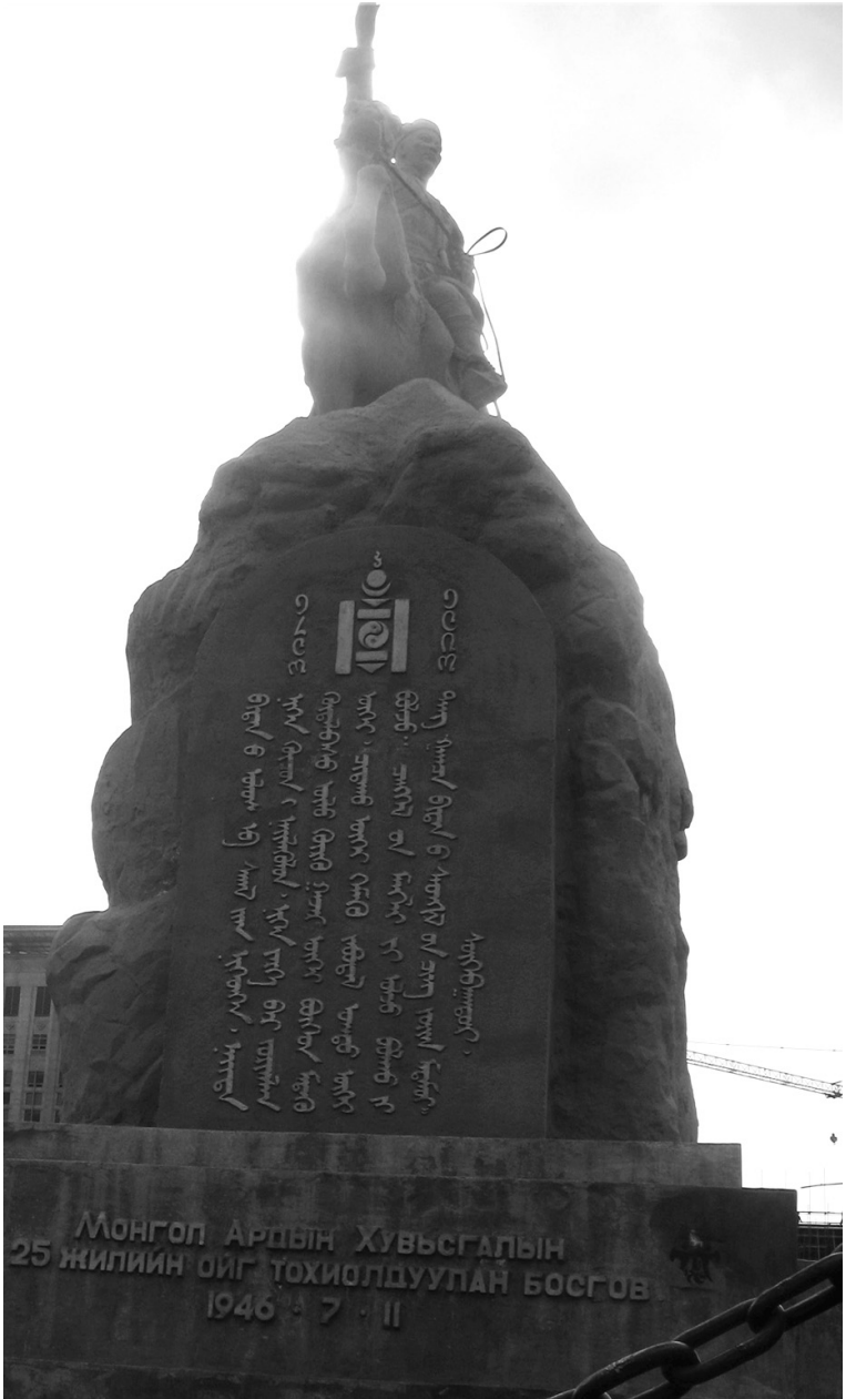
Moğolistan'ın sembol anıtlarından biri