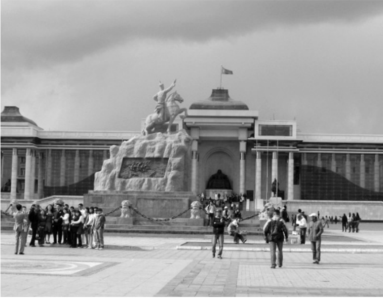
Moğolistan'dan bir kesit

Fakat ne yana çevirseler ağırların azalmak bir yana daha da arttığını görüyorlardı.