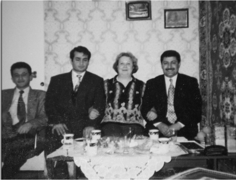
Bir Moğol ailesiyle birlikte

Orada yazılmış her malzeme Moğolistan'da "yok" anlamına geliyordu ve bunun üzerinden bir muhakeme ile Moğolistan'daki hayatın nasıl olduğunu tahmin etmek güç değildi.