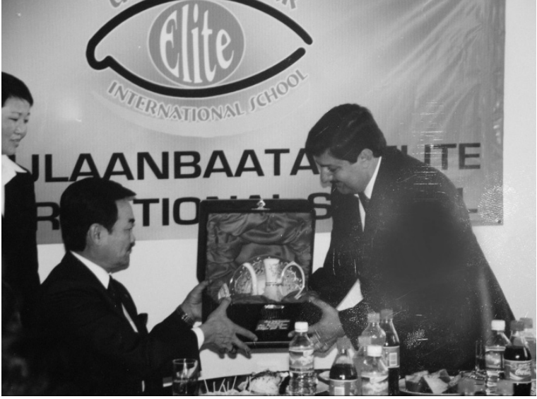
Cumhurbaşkanının elinden hediye alırken

Ulanbatur'u gezen misafirler sabah erkenden kaldırılıp kahvaltı yapmadan Darhan'a doğru yola çıkartılırlar.