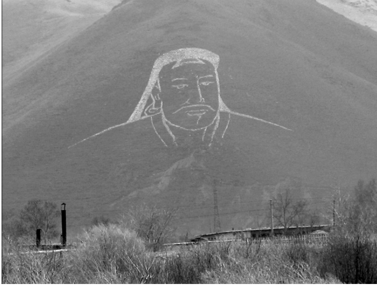
Dağa çizilen Cengiz Han portresi

bütün öğrenciler buna itiraz etmişler, sonuçta okul kantininde tuzlu çaya devam edilmişti.