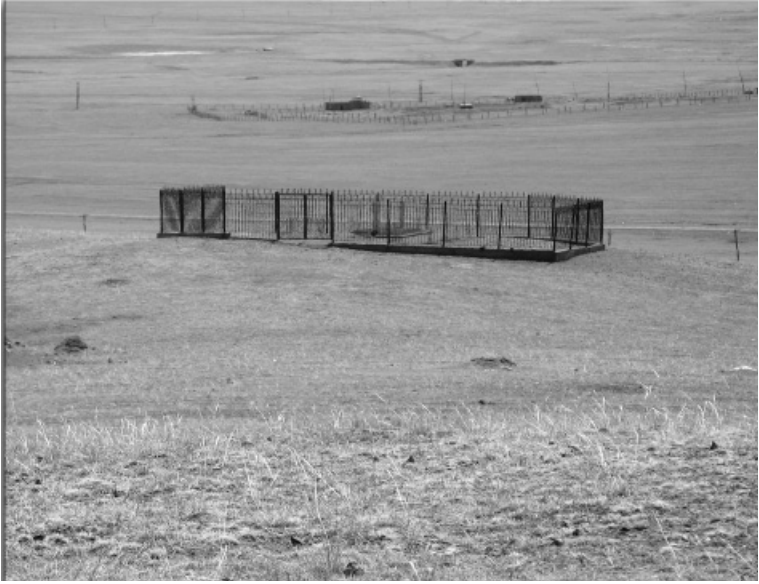
Moğol hükümetinin tahsis ettiği, etrafı çitle çevrili mezar alanı

Kefenleme bittiğinde Asım hoca da bitmişti, cenazenin yanına çöküp kaldı ağlayarak.