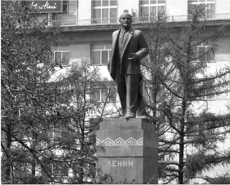
Moğolistandaki sovyet etkisinin izlerinden Lenin heykeli

Doksanlı yıllarda Moğolistan'a ilişkin olarak yapılacak bir tespit, genel resim hakkında da fikir verecektir.