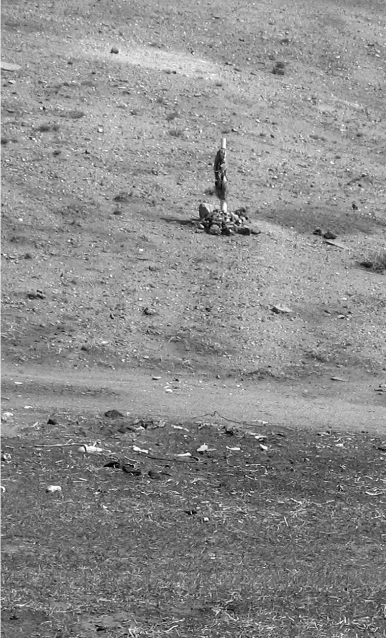
Adem Tatlı'nın kaza yaptığı yerde Moğollar'ın diktiği hadık.