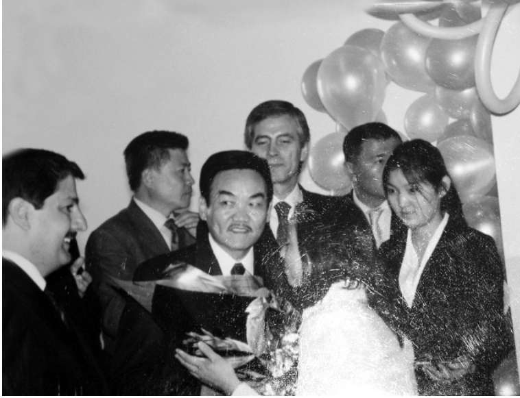
Moğolistan Cumhurbaşkanı Türk kolejini ziyaret ederken